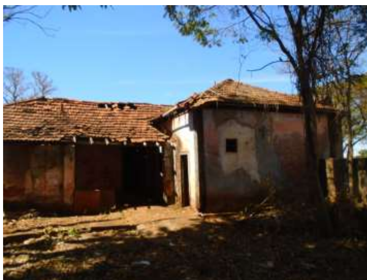
Figura 17. Fachada posterior. Ausência de telhas e caibros aparente no beiral. Foto Raquel Córdova Christófar. Agosto/2020.

A cobertura se faz em múltiplas águas, com engradamento em madeira e manto de telha cerâmica tipo francesa. Vários pontos da cobertura apresentam ausência de telhas e peças do engradamento quebrada.