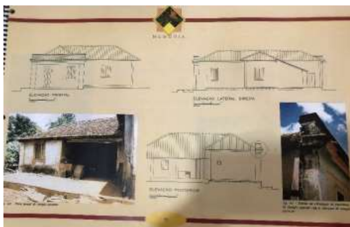
Figura 5. Breve estudo sobre a edificação à Rua Getúlio Magalhães, 192.