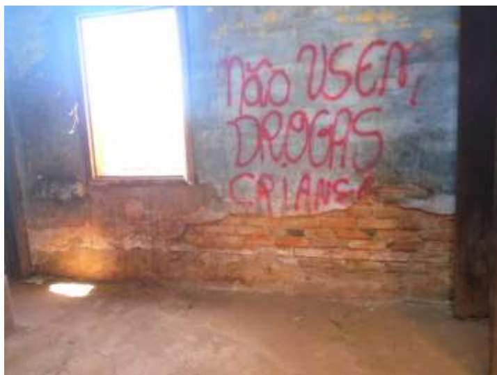
Figura 21. Internamente há paredes com alvenaria aparente e vão da janela desprovida de vedação. Agosto/2020.