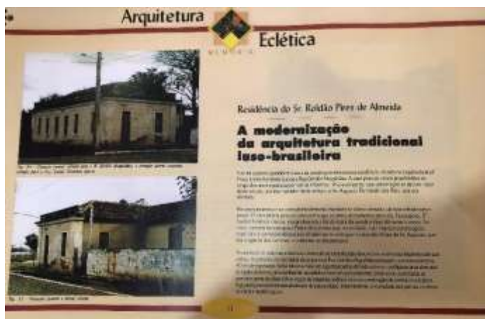
Figura 4. Breve estudo sobre a edificação à Rua Getúlio Magalhães, 192.