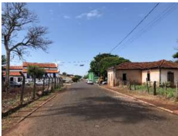
Figura 3. Entorno da edificação à Rua Getúlio Magalhães. Observa-se a proximidade da Igreja de Santana com o casarão.