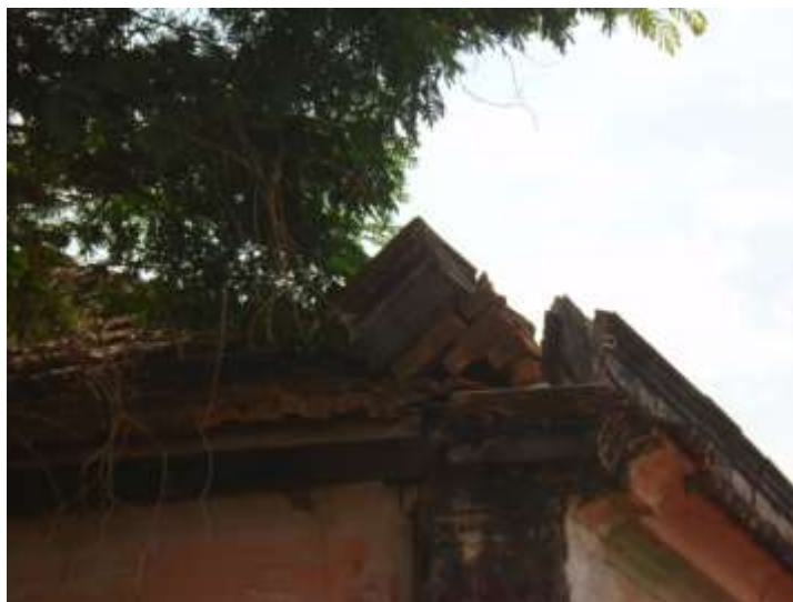
Figura 15. Detalhe da estrutura da platibanda na lateral direita posterior. Agosto/2020.

A edificação composta por um pavimento apresenta partido em “T”, fundação em pedra e estrutura autoportante em tijolos maciços. A fachada frontal e lateral direita conta com cunhais salientes na própria alvenaria, que conformam uma colunata aplainada de capital também aplainado na altura da platibanda, tendo na porção posterior lateral direita parte da estrutura quebrada. A platibanda é conformada por cimalha retangular aplainada em três níveis, que leva acima dessa o arremate em telhas francesas e acima desse arremate em plano retangular de dois níveis, com saliências nas extremidades das fachadas, acompanhamento os cunhais de alvenaria.