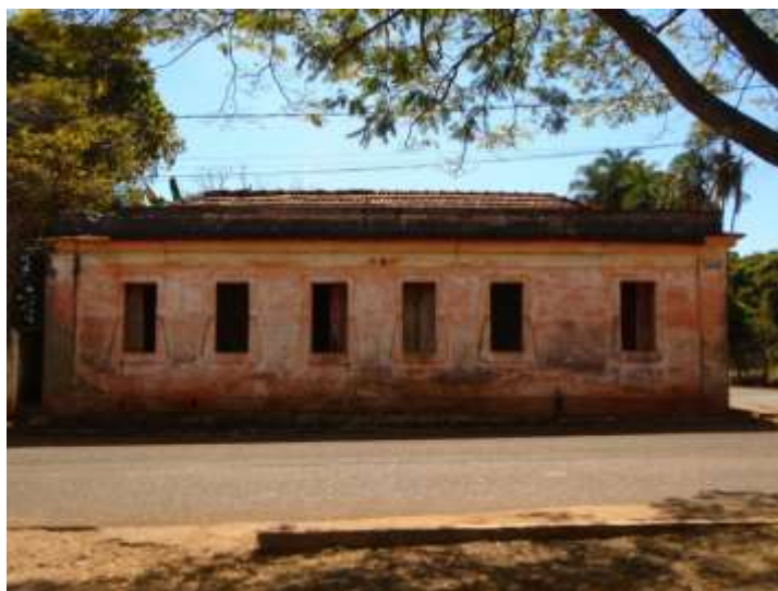
Figura 10. Fachada lateral direita. Simetria e regularidade dos vãos. Foto Raquel Córdova Christófaru. Agosto/2020.