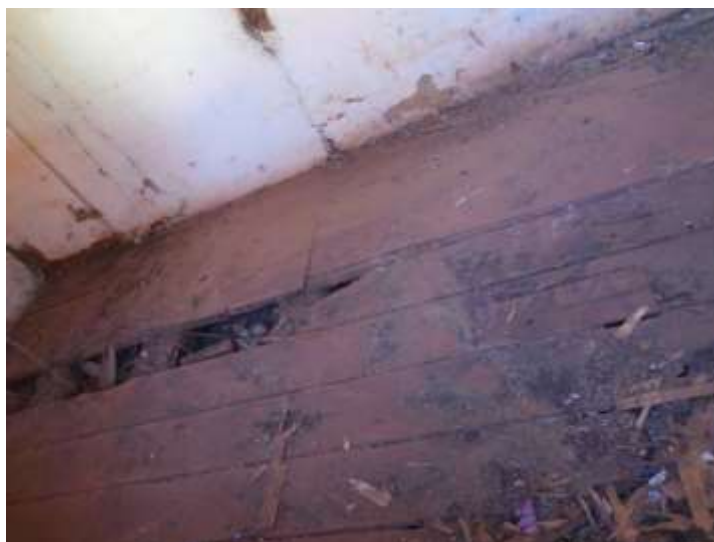
Figura 14. Piso tabuado de um dos cômodos apresenta material deteriorado e ausência de peças. Agosto/2020.

A edificação composta por um pavimento apresenta partido em “T”, fundação em pedra e estrutura autoportante em tijolos maciços. A fachada frontal e lateral direita conta com cunhais salientes na própria alvenaria, que conformam uma colunata aplainada de capital também aplainado na altura da platibanda, tendo na porção posterior lateral direita parte da estrutura quebrada. A platibanda é conformada por cimalha retangular aplainada em três níveis, que leva acima dessa o arremate em telhas francesas e acima desse arremate em plano retangular de dois níveis, com saliências nas extremidades das fachadas, acompanhamento os cunhais de alvenaria.