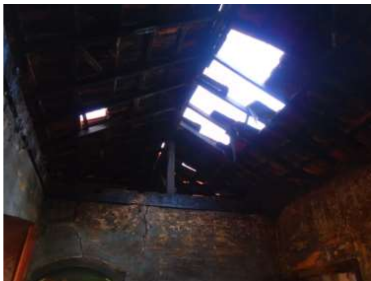
Figura 13. A cobertura está comprometida. Ausência de telhas e engradamento no cômodo que abrigou a cozinha da residência. Agosto/2020.