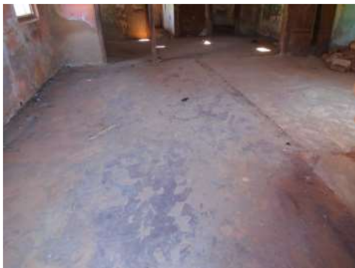
Figura 19. Piso cimentado liso da sala apresenta fissuras e desgaste. Foto Raquel Córdova Christóforo. Agosto/2020.

Já a fachada lateral esquerda, composta por três planos, sendo: dois recuados e alinhados entre si, que correspondem às partes da fachada lateral próximas à fachada frontal e posterior, respectivamente, e um mais avançado, que corresponde à cozinha, área de serviço e despensas desses cômodos. Essa fachada possui duas janelas, uma no plano avançado e outro no plano recuado próximo à fachada frontal, e uma porta no plano recuado próximo à fachada posterior e que corresponde ao acesso ao banheiro. As janelas e portas têm folhas de madeira cegas pintadas na cor marrom e verga reta. A porta possui uma folha de abrir e a janela duas folhas de abrir. Os vãos, tanto da porta quanto das janelas, contam com enquadramento em madeira. A parte da fachada lateral esquerda referente à parede da despensa da área de serviço desabou. Na cobertura da cozinha há parte sem vedação e abaulamento na cobertura e no beiral da área de serviço sobre a despensa e as paredes trincas com desabamento iminente.