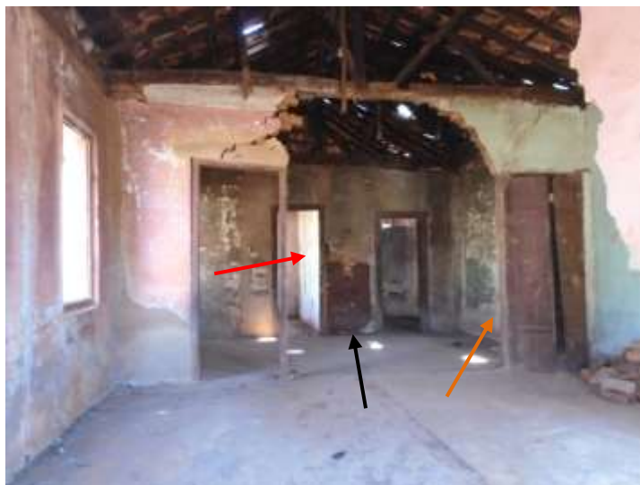
Figura 16. Paredes de pau-a-pique apresentam abaulamento e ausência de reboco e pintura. Indicada com seta vermelha parede do cômodo que serviu de consultório, seta laranja parede de divisa da cozinha. Agosto/2020.

Internamente ainda existem três paredes em pau-a-pique, uma da cozinha e duas referentes ao cômodo que era utilizado como consultório odontológico nos primeiros anos da edificação, sendo o último cômodo no encontro na fachada lateral direita com a fachada posterior, onde há abaulamento da estrutura e desprendimento do reboco e da pintura em cor terrosa.