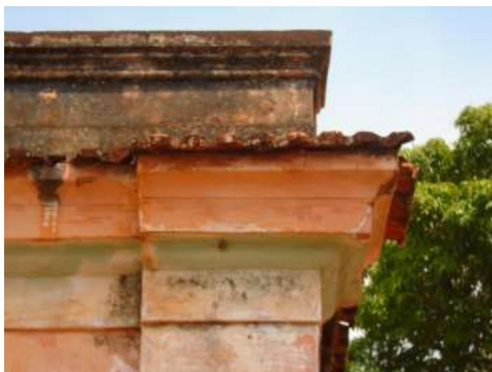
Figura 11. Detalhe da platibanda com detalhes simples. Agosto/2020.