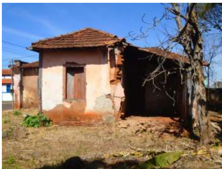
Figura 12. Fachada lateral esquerda. Detalhe da parede que desmoronou. Agosto/2020.