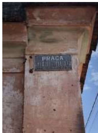
Figura 2. Edificação à rua Getúlio Magalhães.