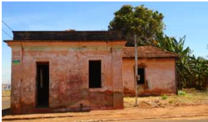
Figura 20. Fachada frontal desprendimento do reboco e alvenaria aparente. Agosto/2020.

conta com uma folha de abrir e a porta duas folhas de abrir. Já no plano mais avançado do banheiro tem-se a janela dele, que possui esquadria metálica e sem vedação, do tipo basculante.